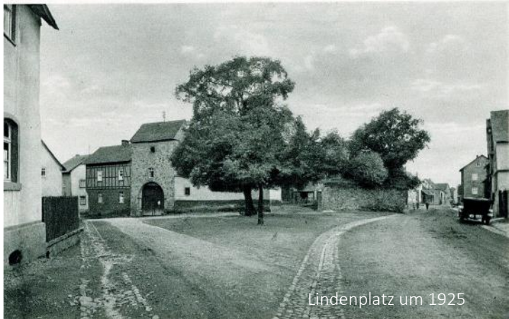
Lindenplatz um 1925