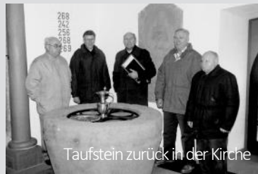
Taufstein zurück in der Kirche