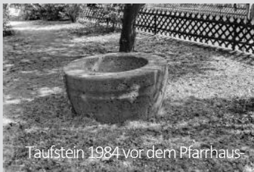
Taufstein 1984 vor dem Pfarrhaus