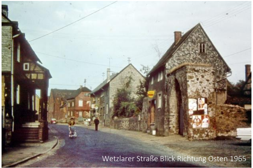
Wetzlarer Straße Blick Richtung Osten 1965

serklosters Dorlar als Folge der Reformation folgten mehr als 400 Jahre, in denen die baulichen Reste des Klosters, vor allem bedeutende Teile der mächtigen Mauer mit den beiden Toren, sichtbar an die