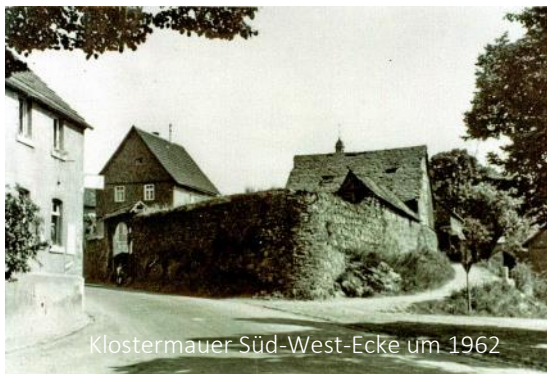
Klostermauer Süd-West-Ecke um 1962

Bis heute ist der Verlauf der starken Mauer bekannt, die das Klosterareal sichernd umschloss. Vor einigen Jahrzehnten waren noch erhebliche Teile der Klostermauer sichtbar. Einige freistehend, andere als integrale Teile von später darüber errichteten Baulichkeiten. 1947 wurde die Nord-Ost-Ecke der Klostermauer abgerissen, in den 1960er Jahren erlitten auch die Nord-Westecke, über der eine Scheune aufgerichtet war, das benachbarte ehemalige Nordtor des Klosters sowie die mächtige Süd-West-Ecke unweit der